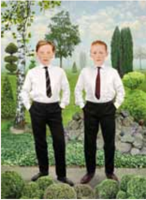
Ruud van Empel, Sunday # 8 , 2012, archival pigment print-framed.

Jeugdinstellingen tussen romantiek en trauma