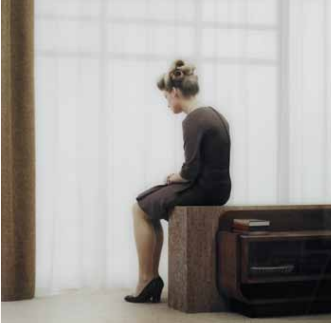
Erwin Olaf, Irene scene (detail), uit de reeks Grief , 2007, foto.

Donkere kamers brengt de verschillende gedaantes van de eeuwenoude melancholie in beeld, maar belicht ook haar hedendaagse, ziekelijke evenknie, de depressie. Het laat zien dat de zwaarmoedigheid niet alleen veel kunstenaars en onderzoekers heeft getroffen, maar ze ook sterk heeft geïnspireerd. Donkere kamers werpt een blik op die artistieke fascinatie en confronteert ze met de psychologische dimensie.