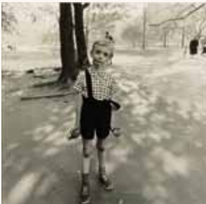
Diane Arbus, Child with toy hand grenade in Central Park , New York City, USA, 1962, foto. Courtesy Fondation Francis, Senlis

Een warm nest waar kinderen in opgroeien: het is een romantisch beeld. Maar wat als het gezin niet beantwoordt aan die verwachtingen? Wat als de minderjarige zelf voor problemen zorgt? In het belang van het kind grijpt de overheid in. Maar wat betekent dit voor het kind zelf? Is een plaatsing in een gezinsvervangende instelling een tussenhalte, een pleisterplek, of is het een levensbepalende, soms traumatische ervaring?