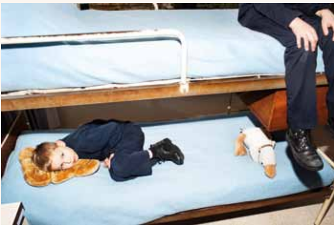
Titus Simoens, zonder titel , uit de reeks Blue.see , 2012, foto. © Titus Simoens, Gent

Pleisterplekken toont de geschiedenis van de jeugdzorg, van het optimisme over de instelling als pedagogische oplossing tot de recente gevoeligheid voor kwetsende praktijken. Jeugdinstellingen voorzien in zorg en bescherming, maar kunnen ook wonden nalaten. Worden kinderen er grootgebracht of net kleingehouden? Pleisterplekken nestelt zich in een actueel en levendig debat en wil de vele vragen rond jeugdzorg visueel intensifiëren.