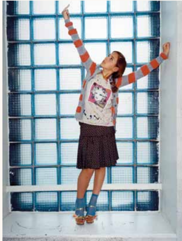
Sergey Bratkov, Motio #2 , uit de reeks Kids III , 2004, foto. Courtesy Galerie Transit, Mechelen